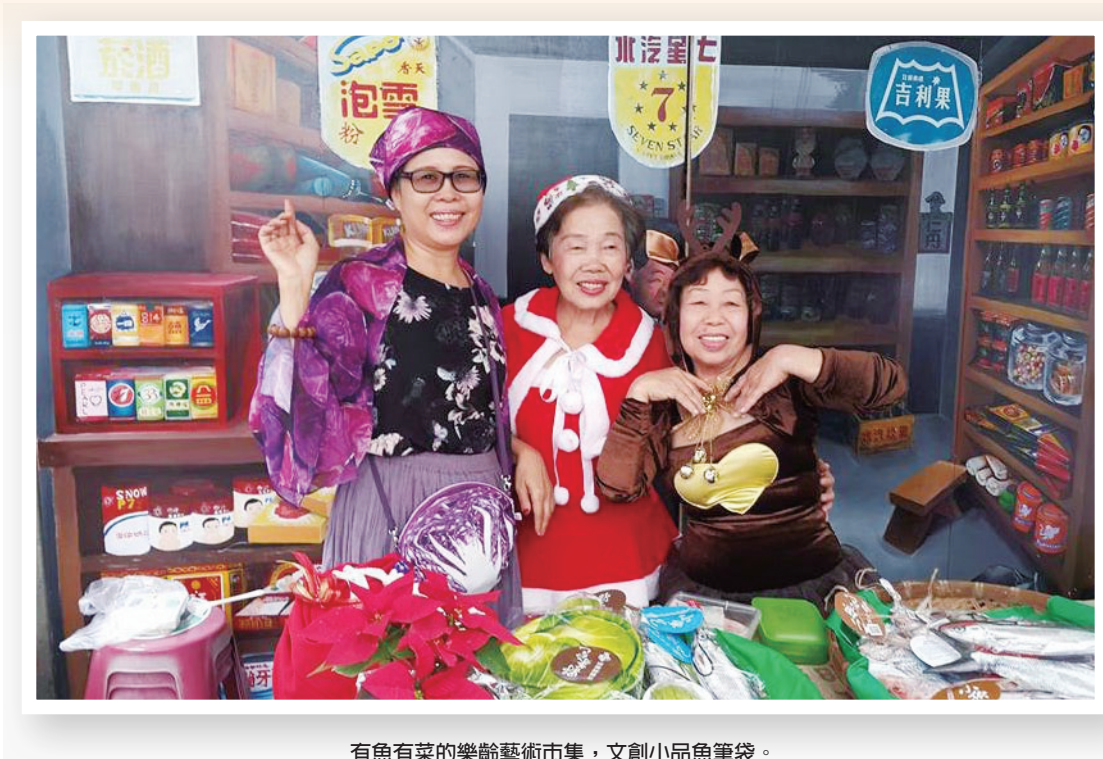
有魚有菜的樂齡藝術市集，文創小品魚筆袋。