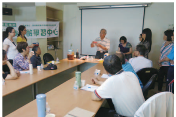
食農食健康 ~ 酵素 ~ 蔬菜