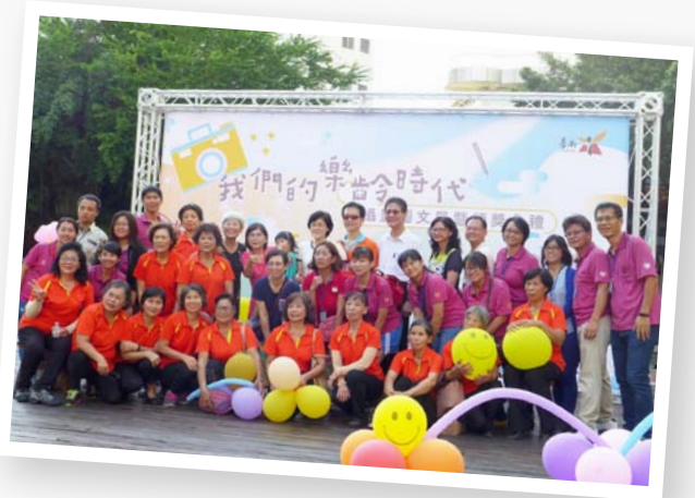
我們的樂齡時代- 創新活動紀錄樂齡學習

臺南市透過公開活動使高齡者有發揮創意展現活力的機會，亦提高臺南市樂齡學習中心能見度，讓民眾對樂齡有更深入了解及提升興趣。現場有動靜態表演，提供舞臺展現各區特色，現場除靜態作品擺飾還有互動體驗手作課程，如婆姐彩繪、藥草膏製作、DIY 米香餅…等；動態表演有樂齡婆姐藝陣表演、安南區樂齡車鼓陣、左鎮祖孫代間鬥牛陣表演、東區府城青春夢舞臺劇…等。