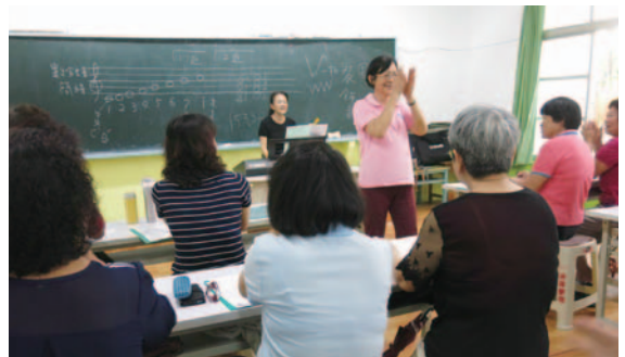
客家歌謠班 ~ 健康律動