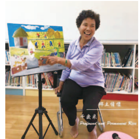
池上鄉樂齡中心 引導學員進行生命故事繪畫創作

臺東縣了解自身樂齡學習推動工作能量較為不足，故特別辦理樂齡中心縣外交流參訪活動。除了至屏東縣樂齡學習示範中心進行參訪也陸續與高雄市林園區樂齡中心、嘉義市西區樂齡中心、雲林縣樂齡學習示範中心等進行觀摩，其運作模式、課程規劃、招生行銷等皆為觀摩學習重點，同時相互交流分享樂齡中心經營心得及經驗，以使樂齡中心瞭解樂齡工作的重要性，進而反思自己與別人不一樣的地方，並檢視樂齡中心之經營是否有需要修正之處，汲取他人優秀的經驗來強化自身不足之處。