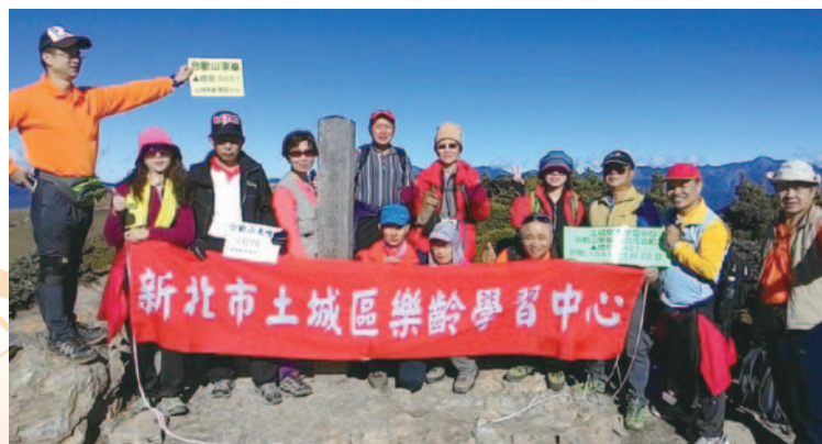
登山班 - 百岳行程