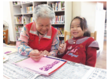
池上鄉樂齡中心進行代間教育繪畫課程

臺東縣辦理新設樂齡中心期初訪視，樂齡中心期中、期末實地訪視輔導，集中訪視，旨在了解其實際運作及執行情形並給予協助及建議、強化其辦理成效及提升專業知能。此程序嚴謹，首先擬定訪視計畫及訪視紀錄表，並聘請具高齡 ( 成人 ) 教育專長之委員，而後函文並於樂齡學習網公告各樂齡中心訪視輔導事宜，再實施各樂齡中心自我評估，最後實施訪視輔導並檢視前次訪視輔導中委員建議事項之改善情形。