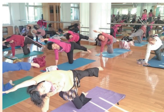
「活到老動到老」銀髮族體適能及運動