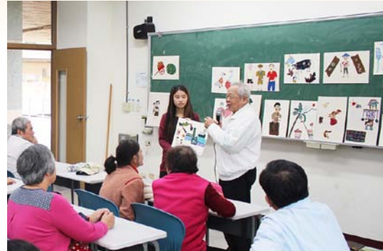
樂齡學員花蓮東華大學三媽貼布畫生命故事分享

巧，讓人相互理解、認識，進而改善人際關係。透過故事及生命經驗分享貢獻服務，是樂齡人力資源開發的創新方式，也是創造微經濟的途徑。中心的理念是：「讓老人家懷念自己以前所做過及發生過的事，可以使老人家重新找回當時的自信及回憶」。