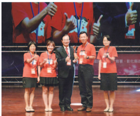
樂齡藺草教學，協助學校獲得教學卓越金質獎