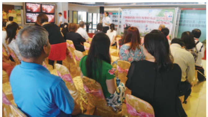
雲林樂齡表揚典禮