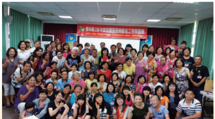
樂齡學習志工培訓

雲林縣為了促使輔導工作順利進行，積極招募退休公教人員，並針對此族群設計樂齡教育志工的基礎訓練、特殊訓練、進階研習等課程，進而聘任其為樂齡志工，分組辦理訪視及各項相關工作，以襄助輔導團輔導業務。