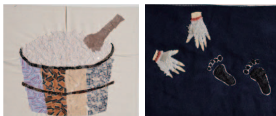
米飯：生命故事 - 不分時間、族群、空間，大家的辛苦都是為了那一鍋熱騰騰的飯

壽豐鄉樂齡學習中心為進行課程深化之設計，以服務貢獻為主軸，藉由生命統整與人際關係的結合，將此概念帶入教學設計中，希望每個教學現場都有獨特的發展方向。壽豐鄉樂齡學習中心在不仰賴外來資源的條件下，發展在地的課程特色，讓任何人都可以在此理念與基本的原則上設計自己獨特的教案。