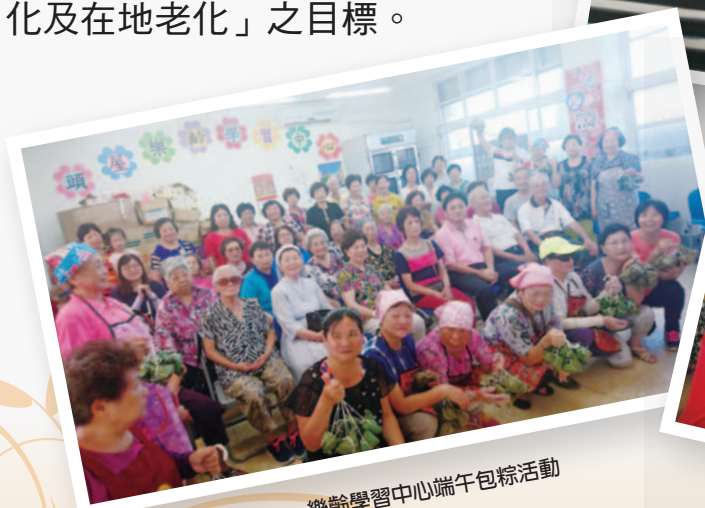
樂齡學習中心端午包粽活動