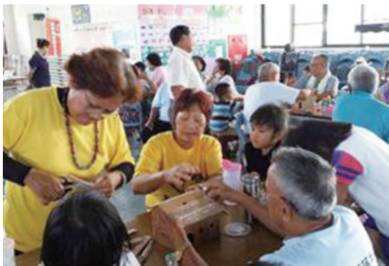
自主規劃課程 - 學藝祖孫情 - 石板屋的重現上課的情形。

屏東縣運用閒置空間，結合民間資源，打造國內第一所以美學為學習主軸的樂齡中心—屏東縣樂齡學習示範中心。並於 104 年 5 月 2 日榮獲教育部推薦總統蒞臨屏東縣參訪。此外，本縣配合教育部推動社會企業計畫及創新方案之政策，由屏東縣樂齡學習示範中心辦理 104 年「樂齡學習中心試辦社會企業申請計畫」，展開樂齡學習中心結合社會企業的理念與精神，讓中高齡與弱勢的學員習得一技之長，進而將學習成品變成商品，透過品牌銷售改善經濟。