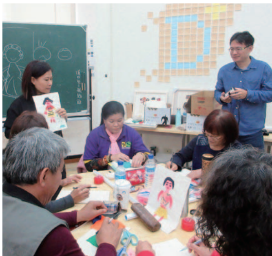
花蓮各令樂齡中心志工培訓工作坊 - 三媽貼布畫操作

壽豐鄉樂齡學習中心由花蓮縣的牛犁社區交流協會承辦。此協會的宗旨以建立具現今居民特色的社區營造工作為志業，關懷觸角伸及村中的老人、婦女以及青少年。協會亦關切自身的客家認同，希望透過對客家歷史、禮俗及生活紀事的追尋，逐漸為豐田勾勒出一個二次移民村的架構。壽豐鄉樂齡學習中心以整個鄉鎮為單位，秉持資源共享原則，在 11 個村開設 12 個班級。