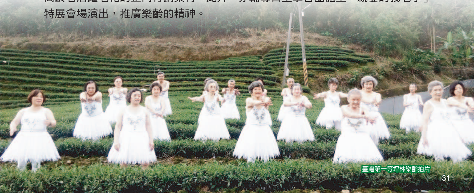
臺灣第一等坪林樂齡拍片

新北市為行銷推廣樂齡學習，協助教育部拍攝紀錄片微電影，記錄全國參與「推動高齡自主學習團體終身學習活動試辦計畫」第 2 階段帶領人籌組及運作自主學習團體之歷程，採訪高齡者樂活學習的各種案例，彙集感人故事，作為激勵高齡者活躍老化的正向行銷素材。此外，亦輔導自主學習團體至「親愛的我老了」特展會場演出，推廣樂齡的精神。