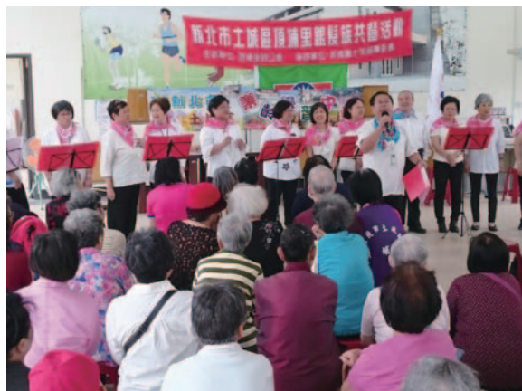
頂埔里老人共餐義演 - 陶笛班

土城區樂齡學習中心願景為「以核心課程 - 延續退休學習生活」、「以自主課程 - 增進個人特色專長」、「以貢獻課程 - 充實人生服務生活」。中心每期學員均達 300 人以上，其中具特色的為陶笛班、編織班、登山班。此外、電腦進階、經絡保健課程等都是非常受歡迎的課程。中心每期固定舉辦一次成果發表會，給予學員在學習之餘，也有表現的機會。此外，每期課程皆安排額外的健康講座或樂齡活動，讓學員能有機會接觸到更多的健康資訊與訊息。