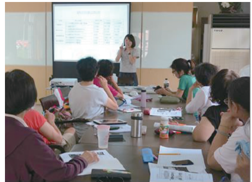
講師以網路安全為例宣導防詐騙

屏東縣人口族群多元，有閩南、客家、原住民及新住民等。以客家聚集的鄉鎮樂齡中心，發展出與在地文化結合的特色課程，而多個原住民鄉鎮也充滿了許多在地學習素材，其中排灣族與魯凱族為主要原住民族群，樂齡中心以 VUVU 的智慧教授傳統技藝，不論是琉璃製作、皮雕、草編、口述歷史、古調傳唱、雕刻藝術、咖啡與紅藜種植等，吸引年輕人返鄉服務與學習，讓技藝得以傳承，樂齡學習中心儼然成為部落新據點，實踐了活躍老化與在地老化的目標。沿海地區鄉鎮呈現海洋風貌樂齡學習風潮，結合在地特色與國小資源，「代間學習」的成效傳承了當地民謠文化意涵，讓月琴彈唱有新生命延續，小朋友以樂齡長者為師，進而更尊敬長輩。