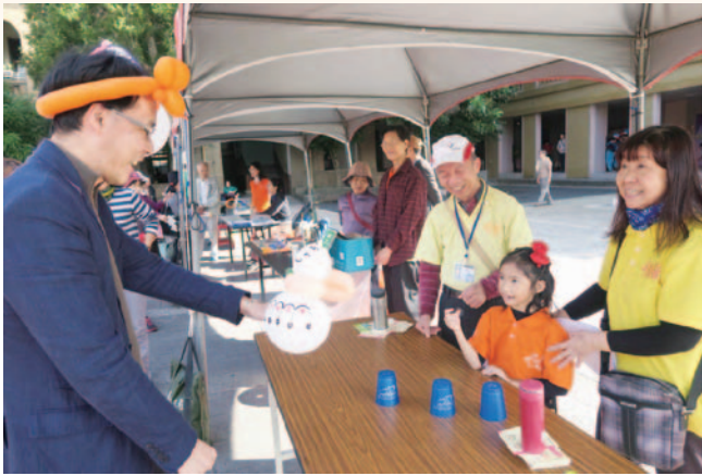
105 年度臺北市樂齡學習聯合成果展—園遊會攤位活動