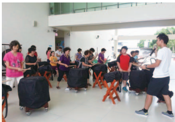
祖孫共學節令鼓促進代間情感