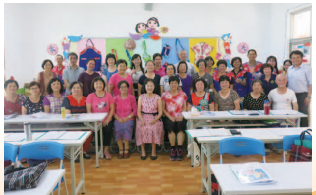
訪視教授們～客家歌謠班