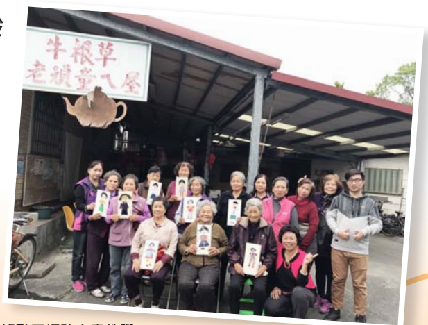
樂齡學員鳳林牛根草據點三媽貼布畫教學

壽豐鄉樂齡學習中心不遺餘力地培育中壯年，以做中學方式進入樂齡學習中心，不僅鼓勵他們終身學習，並進一步與高齡者共同進行社會參與。在陪伴的過程可增強其在課程規劃及行政作業的能力，並且以代間教育方式進入青少年場域，以傳承長輩的生命經驗及人生累積的智慧，使歷史及文化得以傳承。103 年度榮獲第二屆教育部樂齡教育奉獻獎—優等團體獎。