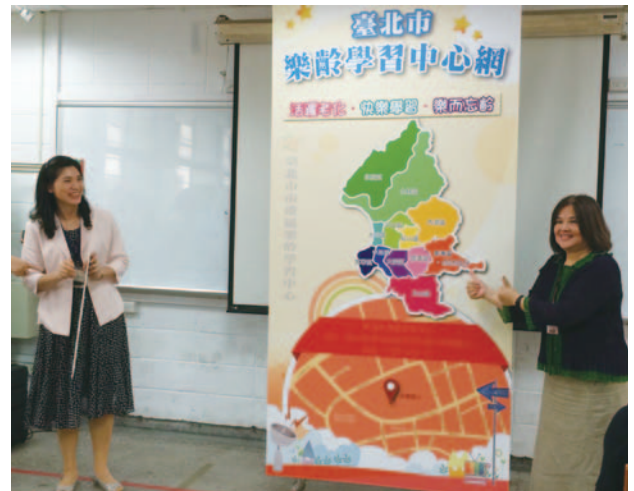
南港區樂齡學習中心揭牌儀式— 106 年度成立第 12 所樂齡學習中心， 達成一行政區一中心之目標

臺北市 106 年度 65 歲以上人口比率為 16.37%，較臺灣地區平均數 13.86% 為高。因應高齡社會的到來，自 97 年度起，除積極配合教育部於 12 個行政區設置樂齡學習中心，近年為鼓勵 55 歲以上中高齡長者終身學習，以協助其活躍老化、健康老化及在地老化，亦將樂齡終身學習活動列為市府重要施政項目，如「長期發展綱領」（2010-2020）、府級策略地圖及銀髮照顧四年躍進計畫，整體樂齡學習發展政策係框架在「提供終身教育」之課題下進行擘劃，並據以訂定發展願景、施政主題、發展策略及相關計畫。