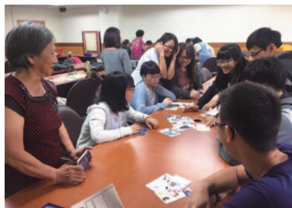
樂齡學員臺師大三媽卡教學演示畫面

壽豐鄉樂齡學習中心的生命統整課程，透過敘說故事以觸及長輩的記憶，並在生命回顧的過程中找回自信，讓學員看見及理解彼此生命的不同。敘說是一種溝通技