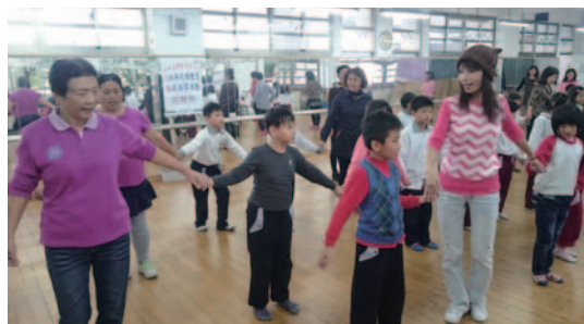
代間教育-祖孫共學活動-排舞班