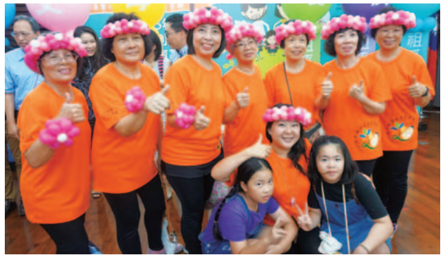
祖父母節花絮合影