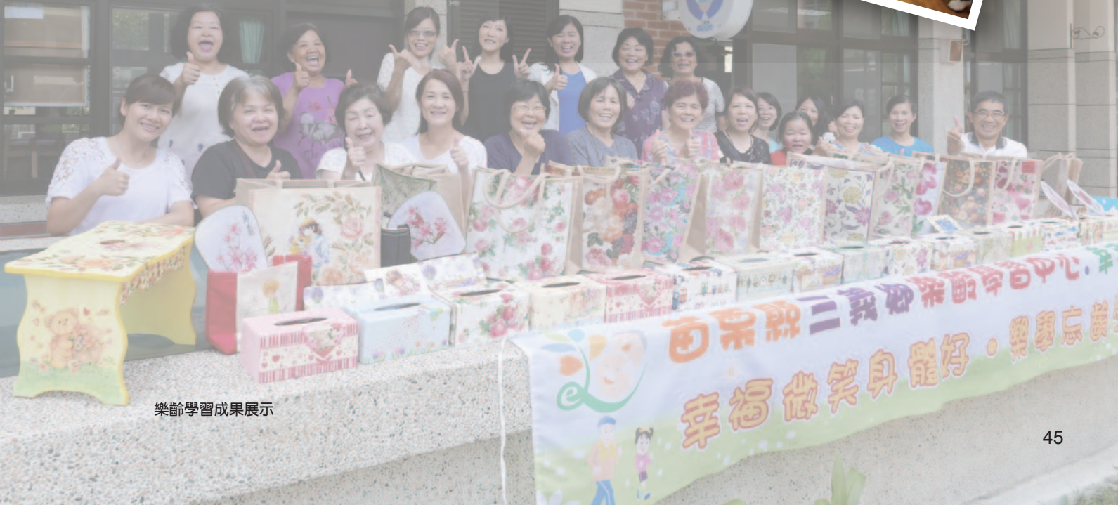
樂齡學習成果展示