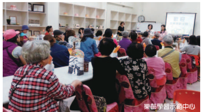
樂齡學習示範中心