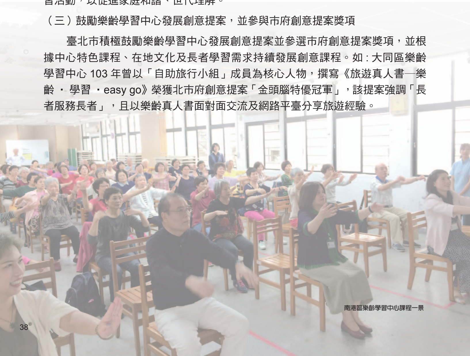
南港區樂齡學習中心課程一景

臺北市積極鼓勵樂齡學習中心發展創意提案並參選市府創意提案獎項，並根據中心特色課程、在地文化及長者學習需求持續發展創意課程。如：大同區樂齡學習中心 103 年曾以「自助旅行小組」成員為核心人物，撰寫《旅遊真人書—樂齡・學習・easy go》榮獲北市府創意提案「金頭腦特優冠軍」，該提案強調「長者服務長者」，且以樂齡真人書面對面交流及網路平臺分享旅遊經驗。