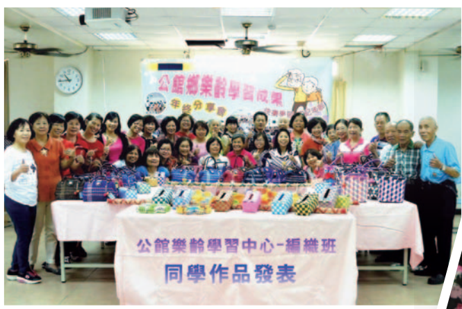
樂齡學習成果展示

苗栗縣提出「關心銀髮族—社區團體作伙來」樂齡學習計畫，結合及善用縣內資源，共同推動樂齡學習工作，營造友善樂齡環境。另外，苗栗縣也根據各鄉鎮市發展特性，協助轄屬樂齡中心，透過「高齡友善城市記者會」協助宣傳各樂齡中心發展特色，協調各鄉公所與樂齡中心的夥伴關係，及輔導創新樂齡活動。