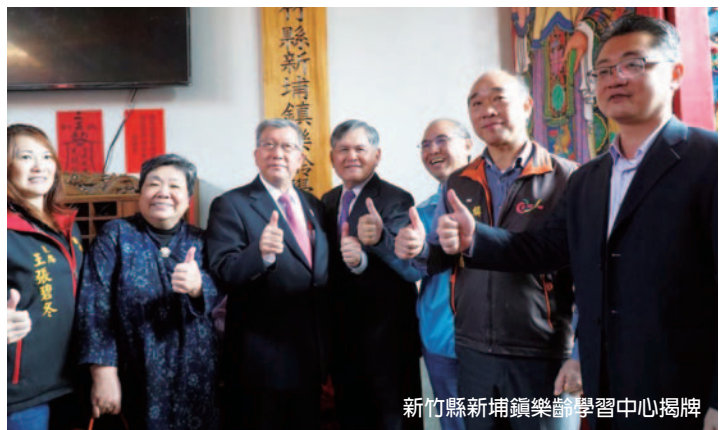
新竹縣新埔鎮樂齡學習中心揭牌

新竹縣結合 95 年教育部《邁向高齡社會老人教育政策白皮書》「終身學習」、「健康快樂」、「自主尊嚴」、「社會參與」之四大願景以及高齡友善城市「敬老、親老、無礙、暢行、安居、連通、康健、不老」等八大面向，以 100 年新竹縣終身教育白皮書擘劃推動藍圖，並納入 104-106 年終身教育中程計畫之整體規劃架構。另依據終身學習法第 14 條擬訂年度樂齡學習推展樂齡中心，建構「樂齡宜居、健康竹縣」。有鑑於此，新竹縣於 97 年開始設置樂齡中心，103 年度完成「一鄉鎮，一樂齡」之設置，105 至 106 年各鄉鎮樂齡中心皆穩定發展，106 年因應教育部樂齡優先區政策，於橫山鄉再新增一所樂齡中心，目前共計 14 所。