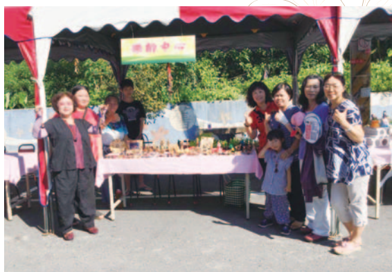
種子 DIY 設攤 - 舊社評鑑二

中心結合傳統文化，使樂齡者體驗傳承——米女尢、享健康：窯烤麵包、烘焙抗老傳承（綠豆碰傳奇——料好實在、不甜不油，獲得大眾迴響）等活動。以上兩種產品皆運用在地農特產進行製作，且已轉為社會企業。中心創造適合長輩輕鬆無負擔的在地學習與產業學習，進而將產品所產生之盈餘所得回饋社會，提供給獨居老人用餐。