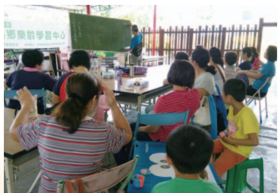
核心課程 ~ 交通安全