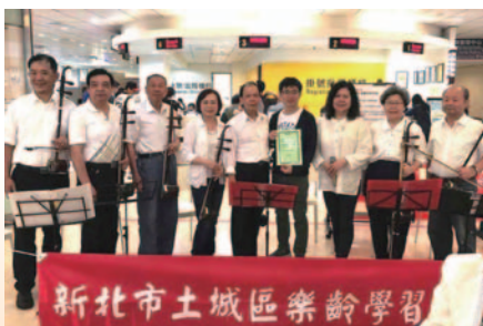
臺安醫院義演-二胡班