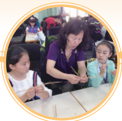
樂齡阿嬤教導學生編織藺草小鹿