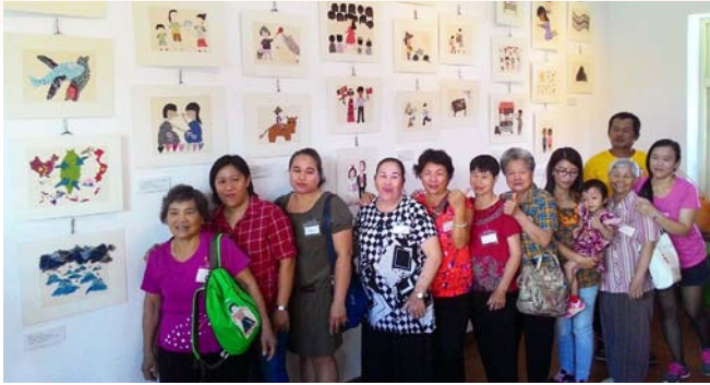
樂齡學員花蓮松園別館三媽貼布畫生命故事分享