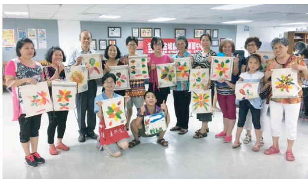
金城鎮樂齡學習中心拓印背包