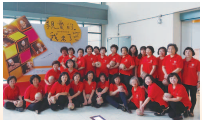
樂齡阿嬤們編織出精緻的藺草球