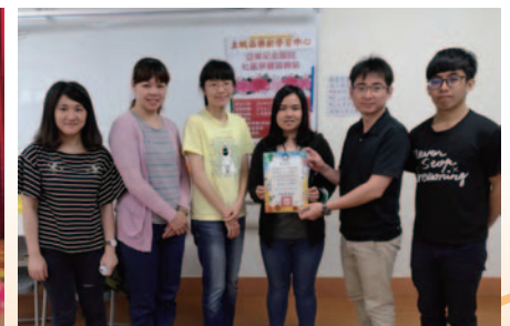
健檢活動-健康諮詢保健站