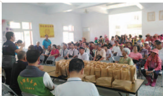
進芬班米胖海鄉送暖關懷老人行動