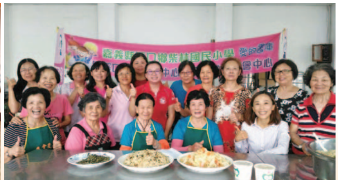
嘉義縣溪口鄉樂齡學習中心阿嬤手路菜活動照片