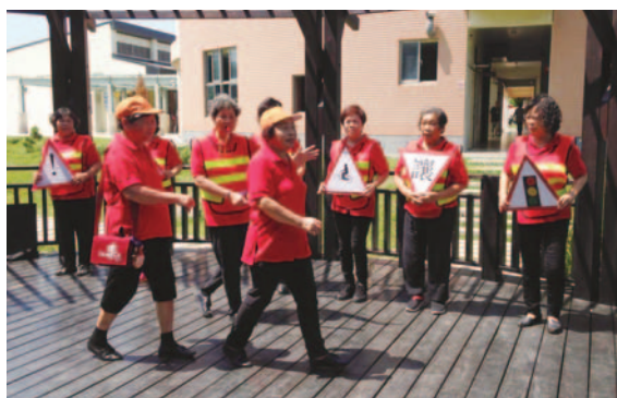
交通安全戲劇宣導排演

苑裡鎮樂齡學習中心提供苑裡銀髮族人口一個快樂學習的場域，結合里辦公室、社區發展協會，及臺灣藺草學會等社區資源，拓展學習中心及社區終身學習的氛圍，並藉由樂齡課程的學習，增加高齡者知識的深度與廣度，豐富生命的色彩。