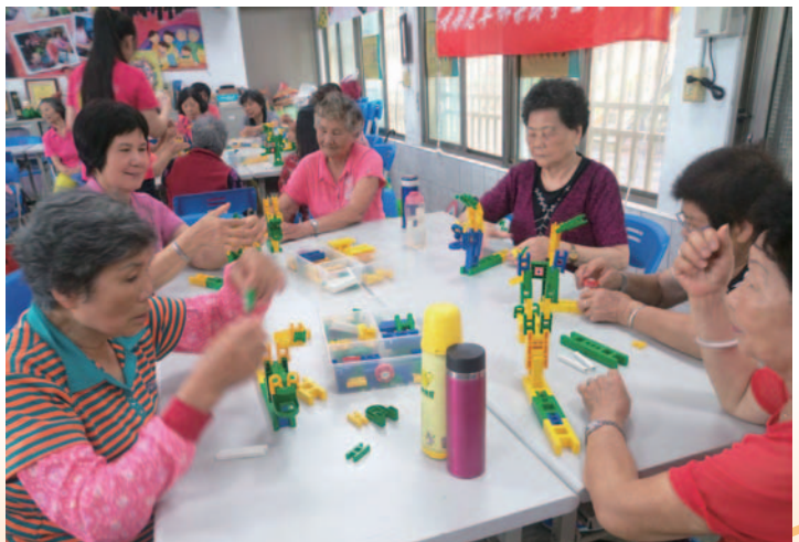
嘉義縣鹿草鄉樂齡學習中心「心靈成長—活化記憶力」活動照片。 說明：簡單的桌遊遊戲，在老師的帶領之下，每位學員都玩得很高興

為拓展嘉義縣樂齡中心的視野，提升服務品質，嘉義縣積極舉辦跨縣市樂齡學習中心交流觀摩參訪，藉由觀摩學習汲取辦理高齡教育的成功經驗，提升嘉義縣各樂齡學習中心工作人員樂齡專業知能與使命感；於觀摩中提供各樂齡學習中心互動交流的對話平臺，讓各中心承辦人員透過彼此交流、增進情誼，促進辦學創新策略。