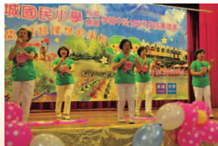
成果發表會-手語歌舞班