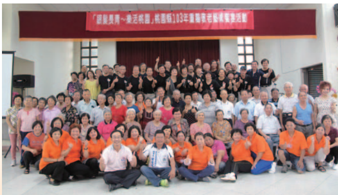
重陽節巡迴表演 - 東勢活動中心

平鎮區樂齡學習中心於教育部第二屆樂齡教育奉獻獎榮獲優等團體獎，積極整合地方資源，課程豐富多元，且凸顯地方特色(如客家文化)，因而提升長輩士氣，嘉惠地方長輩甚多。