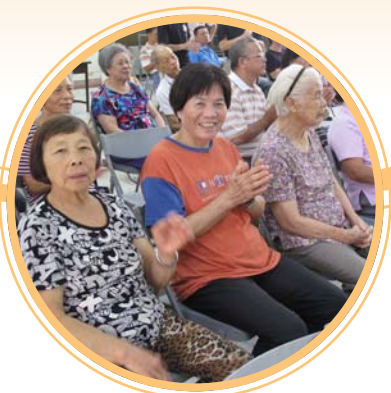
帶給大家歡樂 - 高齡者服務高齡者