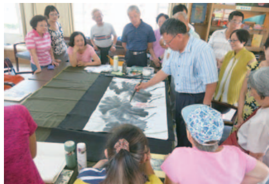
講師示範國畫的山水、花鳥植物畫法，學員都非常專注。