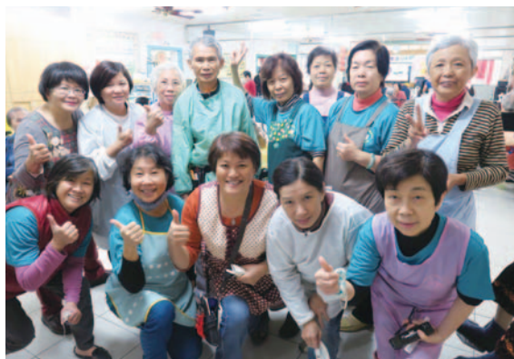
瑞泰長照中心義剪

目前東區樂齡學習中心擁有「樂齡志工隊」，將健康退休者導入高齡志工及服務人力市場。透過交通安全、用藥安全、三低健