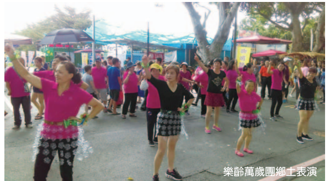
樂齡萬歲團鄉土表演

雲林縣為農業鄉，擁有許多特產與文化，以此作為基礎，雲林縣政府積極協助各樂齡學習中心構思及策劃貼近生活的課程，如以文蛤、鮮蚶、烏魚子出產的口湖，即發展蚵貝畫的課程；以七崁武術聞名的四湖，即發展武術舞蹈課程等，讓樂齡學習能更貼近學員的生活。此外，除了一中心一特色的輔導方針外，雲林縣在樂齡課程上花了不少巧思，並協助中心發展特色課程，如林內的垃圾桶大樂團、北港的旗幟背包、斗南的絲瓜絡燈罩、土庫的花鼓陣、古坑的懷古農具等…都是極有特色的課程。