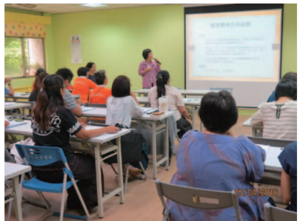
南區輔導團與屏東縣政府聯繫會報

屏東縣境內地形狹長，從海邊、平原、山地到半島；人口族群多元，有閩南、客家、原住民及新住民，各鄉鎮擁有各自的特色。屏東縣將樂齡學習政策納入「屏東縣政府施政總報告」之「安居大社區」專案，由副縣長主持，每月定期召開會議並追蹤執行情形。屏東縣有 33 個鄉鎮市，104 年於 27 鄉鎮成立 28 所樂齡學習中心（含 1 所示範中心、5 所原住民鄉中心、客家地區 7 所中心、1 所離島中心及 14 所鄉鎮樂齡學習中心），設立達成率 82%。105 年成立 33 所學習中心。預計於 106 年全面 33 鄉鎮成立樂齡學習中心，達成 100%。