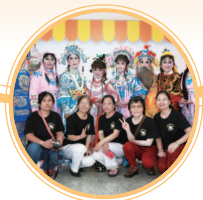
祖父母節歌仔戲演出