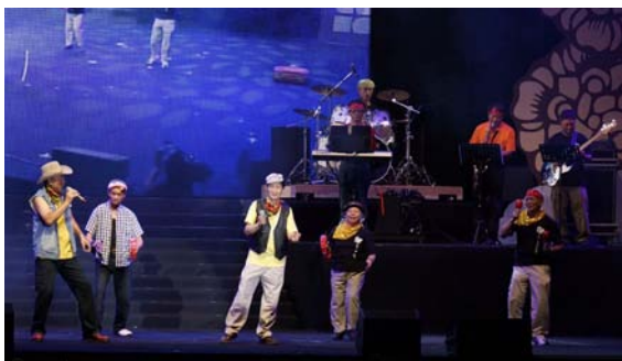
平鎮八號小巨蛋表演

樂團在全省也許有很多，但以「樂齡樂團」成名的並不多。平鎮樂齡學習中心主打樂團的樂齡中心，樂團成員也許不是最年長，但絕對是最會玩樂器的一群樂齡長輩。平鎮區樂齡中心之前座落門牌號碼為 88 號，因此，將樂團命名為「平鎮八號樂齡樂團」，並獲得廣大銀髮族的認同。平鎮八號樂團集結一群樂於分享的長者，進行社區服務，將所學回饋社會。