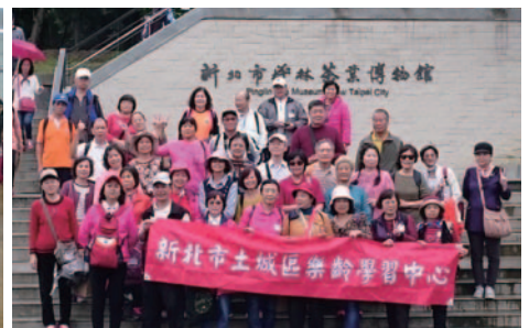
重陽登高健行參訪-坪林茶葉博物館