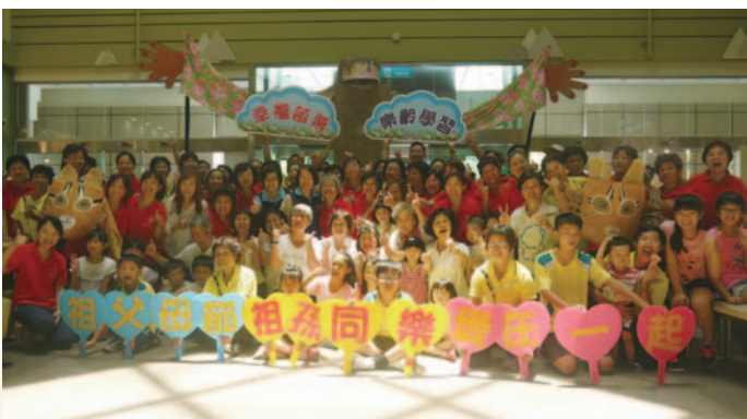
於西湖休息站慶祝祖父母節快閃活動

在地環保行動及代間教育的課程，學員利用畚箕創作保育類動物 - 石虎，結合藺草編織，製作石虎面具在國道西湖休息站，進行踩街遊行。透過祖孫間歌曲演唱及律動，宣傳祖父母節的核心精神，博得觀眾熱烈的掌聲及媒體的大幅報導，更將活動影片上傳影音平臺，行銷苑裡鎮樂齡學習中心。