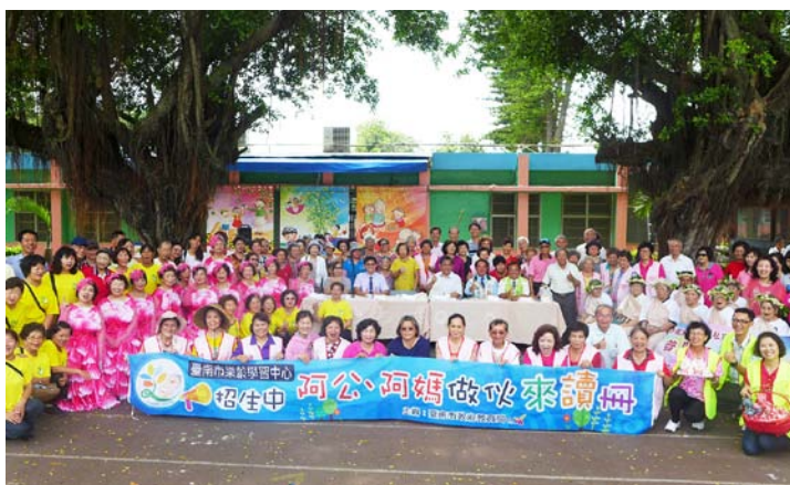
阿公、阿媽做伙來讀冊 ~ 樂齡開學樂 ~

臺南市 105 年 3 月底老年人口比例為 7.19%，其中，37 個行政區中有 30 個區域高於全國老年人口平均值，平均每 4 位即有一位老年人，與日本老年人口比相當。在規劃樂齡學習政策推動策略上，由於各行政區老化程度差異性大，因此，偏重各區的殊異性及普同性，以營造適宜長者的樂齡學習環境。有鑑於