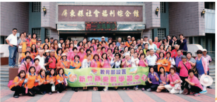
參訪屏東樂齡示範學習中心