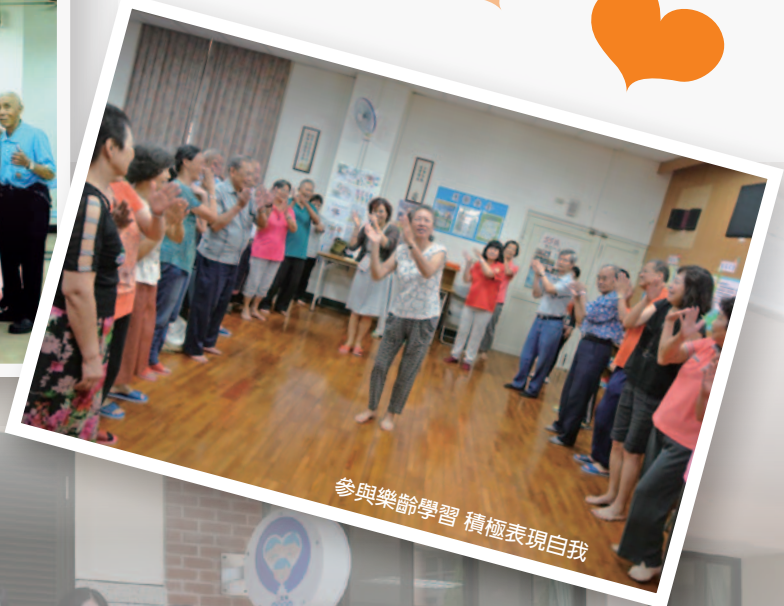
參與樂齡學習 積極表現自我