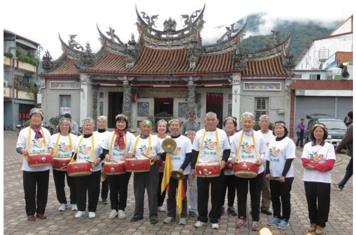
關山鎮樂齡中心客家鑼鼓樂團

臺東縣為使樂齡學習能更普及於各鄉鎮村落，除仰賴地方政府單位（第一部門）外，亦連結企業（第二部門）及民間團體或非營利組織（第三部門），將三方資源相互結合運用，同時融入當地傳統文化及民俗，規劃適合在地特色之活躍老化課程，以使高齡者能透過樂齡學習進而改變與增能，最終達到「活躍老化、在地老化」之目標。