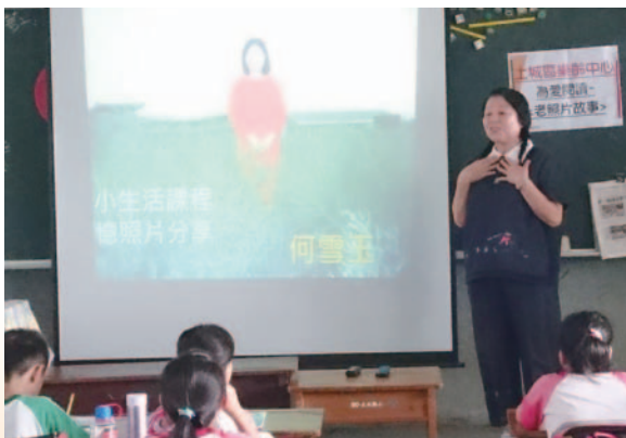
代間教育 - 為愛閱讀 - 老照片故事