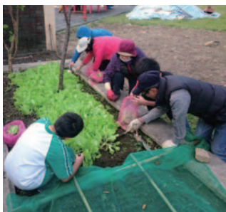
代間教育-夢土計畫

土城區樂齡學習中心也重視學員回饋與表現，積極安排樂齡學員進行表演活動回饋社會，並從中讓學員獲得成就感與學習動力。近兩年演出外部單位公益演出 8 場（亞東醫院、臺安醫院、頂埔里、土城教會等）及學校內部公益演出 10 場，均獲得許多好評。在志工參與的活動也非常多元，包括：協助推動中心業務與活動、植栽組長期認養校園花園、夢土田組與社工配合，帶領弱勢學童於校園內進行農耕活動、支援學校各項活動回饋學校。中心不僅鼓勵學員學習，更鼓勵學員透過不同的活動與形式回饋校園及社會，讓雙方從交流的過程中獲得成長。