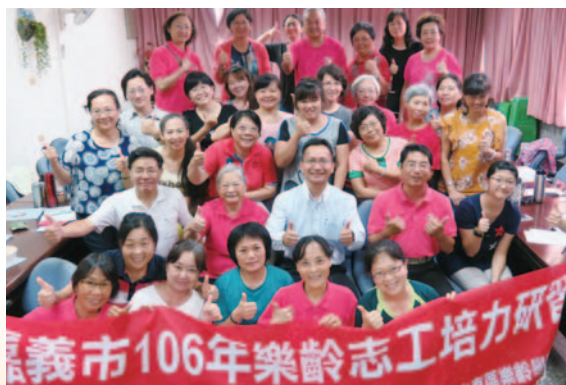
樂齡志工培力~家德老師分享