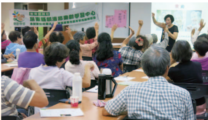
核心課程～樂齡樂活

101 年為了資源整合與推動代間學習，麟洛鄉樂齡學習中心遷至麟洛國小，承蒙校長大力支持提供教室場地與設備，展現非營利組織與在地國小一起推動樂齡學習的新契機。以「創造學習平臺，深耕客家文化永流傳」的願景，促進高齡學習普及化，幫助高齡者圓夢為目標。具體作法包括邀約專業人士，集結打版師、圖案設計師等專業講師，組成「客家藍衫創意團隊」。中心課程內容多元，包括美食、技藝、戶外教學到口述歷史等。此外，亦透過客製化課程傳承客家文化，以達永續經營，深耕在地。中心改變既定學習產業之經營思維，融入企業化經營，規劃產品銷售平臺，將客家藍衫文化藝術推動成地方產業，例如：樂齡好禮格子鋪、與屏東樂齡學習示範中心一同打造樂作品牌與樂作商品，將課程產品變身銷售產品，希望能創造收益，延續作品的生命。