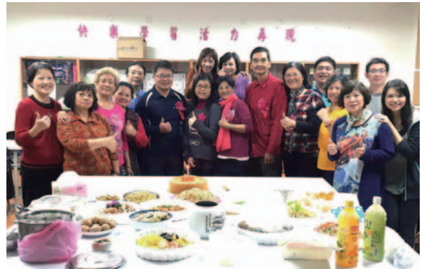
樂齡 12 月份慶生會

土城區樂齡學習中心在課程方面，開設適合樂齡者之課程，106 年度已開設 18 門，其中陶笛與歌唱、二胡、經絡保健、登山等都極受好評。中心依學員程度，鼓勵已學習到一定程度之學員成立自主學習團，目前已有陶笛與歌唱、二胡、排舞、柔力球等 4 個自主學習社團。中心與亞東醫院長期合作，每年安排 10 場以上健康講座或健檢。另外