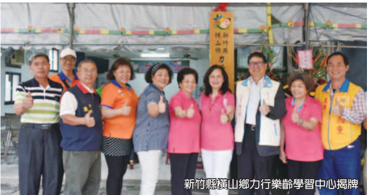
新竹縣橫山鄉力行樂齡學習中心揭牌