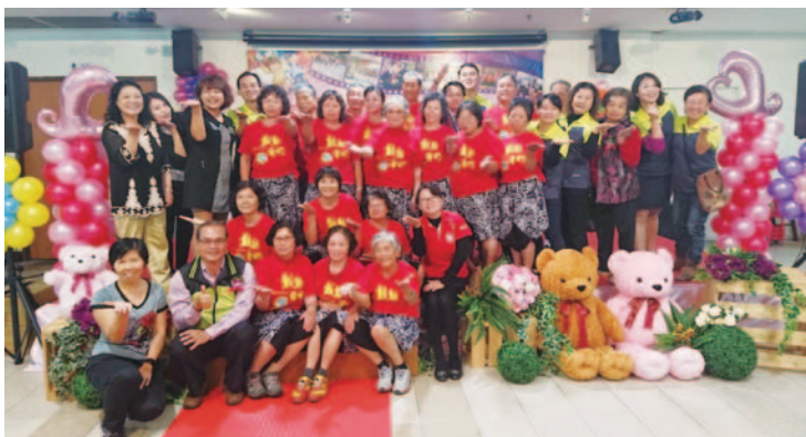
嘉義縣105年度樂齡學習中心成果發表會~ 溪口鄉樂齡中心鼓動爺奶合影

嘉義縣現為全國人口最老化的縣市，老年人口比率從 96 年起就持續高居臺灣第一位，截至 106 年 12 月底，嘉義縣 65 歲以上人口佔嘉義縣總人口數 18.46%，成為全臺最老城市。嘉義縣依據教育部補助辦理樂齡教育活動實施要點，承繼開辦樂齡學習中心之核心價值，秉持「高齡者中心」、「深耕、創新」與「學習、改變、增能」等精神，以「在嘉老化、快樂學習」之推動理念，積極規劃推動老人教育活動。嘉義縣雖是地廣人稀，但擁有山、海、平原等得天獨厚的多元資源；雖是老、苦、窮之高齡老城，但擁有質樸並堅忍的風土民情。自 2008 年起，配合教育部開辦樂齡學習中心計畫，從 7 個試辦鄉鎮據點，到目前已有一鄉鎮一樂齡之欣欣向榮的亮眼成績。