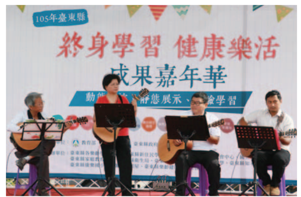
臺東縣「終身學習·健康樂活」成果嘉年華： 臺東市樂齡中心不老樂團展演。→

我非常感謝樂齡學習中心以及推動樂齡教育的工作夥伴，有他們的支持與努力，臺東縣在樂齡學習整體發展上才有亮眼的成績，期盼大家都能「快樂學習、忘記年齡」！