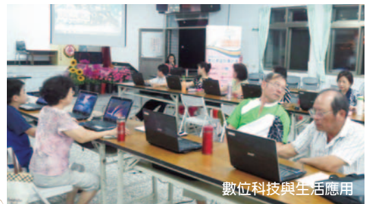
數位科技與生活應用