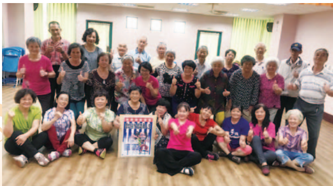
嘉義縣番路鄉樂齡學習中心—番路爺奶強化體能舞人生，延展肢體、活絡筋骨，躍出樂齡不老精神！

嘉義縣運用在地資源整合推動社會企業模式，創造中高齡者的新價值。如徵選青年返鄉貢獻所長，透過代間學習、青銀共創等學習方式激發創意發想，並將課中所學回饋社會，提升高齡服務學習動能，為樂齡學習中心注入新的學習能量，為高齡者服務社會創造新的價值，達到青銀共創社會企業學習方案的核心目標—轉動高齡正能量，增進社會公益服務之目的。