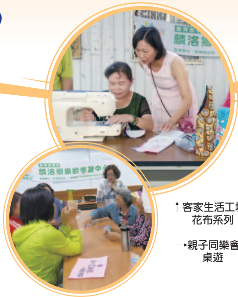
↑ 客家生活工坊 ~ 花布系列 → 親子同樂會 ~ 桌遊

麟洛鄉樂齡學習中心與鄉公所合作，開設客家生活工坊(客家創意拼布包、藍衫製作)。此外，連結的單位包括與新田村大憨咕發展協會(手工童玩、客藝剪紙)、田心