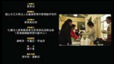
主辦單位 屏東縣 國立中正大學老人及服務管理學系服務學研究所 協理單位 屏東縣政府 在職人員專業發展中心及屏東縣社會局 (屏東縣樂齡學習示範中心) 協理單位 屏東縣、屏東市、中埔鄉 主任 陳文華 協理 陳仲輝、羅敏如