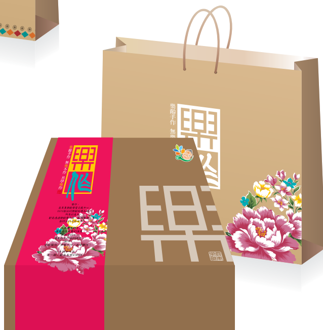
樂齡好禮〔客家風格〕