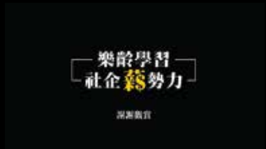
樂齡學習 社企新勢力