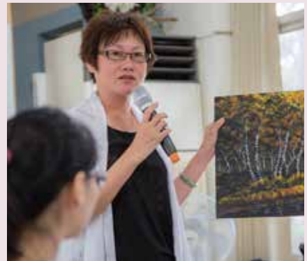
不同世代的老師與產品