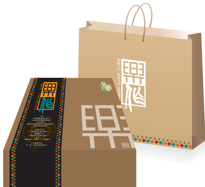
樂齡好禮〔原民風格〕