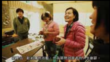
國語、對的溝通技巧，傳點弱勢婦女的生活創新。