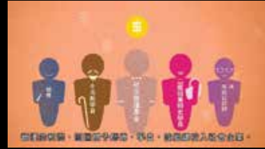
你們好快樂、樂齡中心學藝、巧思、給您歡樂及安全感。