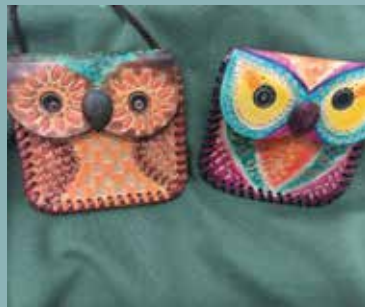
〔貓頭鷹款皮製零錢包〕