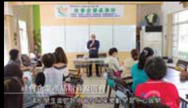
社會企業經營培訓課程 為新進生進修及研習的課程，由中心提供