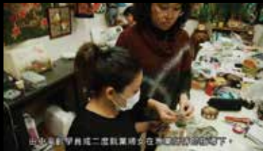
由樂齡學習中心二樓就業婦女在專業師傅指導下。