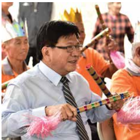
屏東縣縣長 潘孟安